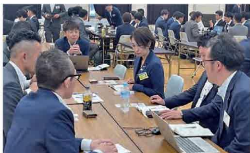
単会の課題等について議論する会長たち