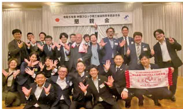
単会の枠組みを超えて懇親を深めるYEGメンバー