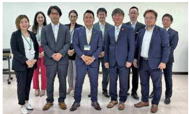
参加された浜田YEGメンバー

今年度、浜田の地にて行われる県連を島根県全体で盛り上げ、この会議の意義を皆様と共有できるよう一生懸命努めて参ります。