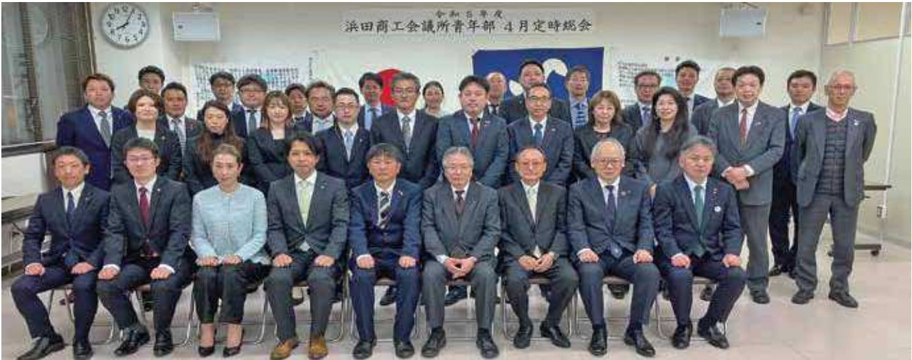
総会参加者で記念撮影