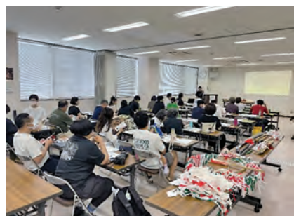
講演を聞き入る参加者