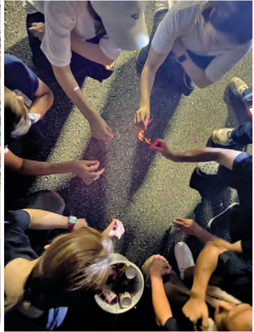
花火で交流を深める会員