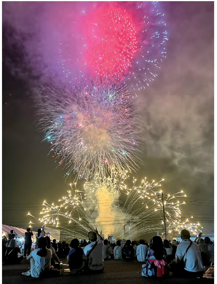
夜空に打ち上がった花火を見上げる来場者